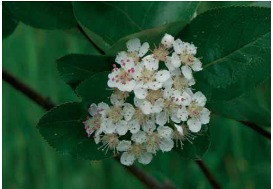
Abb. 3: Aronia Blüten

Die gesammelten Daten zeigen das hypoglykämische Potenzial von Aroniasaft ... seine positiven Wirkungen und sein guter Geschmack machen ihn zu einer wertvollen Ergänzung zur diätetischen Behandlung von Patienten mit Diabetes mellitus. (PMID: 12580526 [PubMed - indexed for MEDLINE])