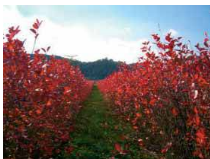
Abb. 2: Aroniapflanzung im Herbst

Die gängigsten verwendeten Sorten für den Anbau sind laut Bayerischer Gartenakademie die Sorten ‚Aron‘ (aus Dänemark stammend), ‚Viking‘ (aus Finnland), ‚Nero‘ (aus Slowakei / Russland), ‚Rubina‘ (abstammend von Viking), ‚Hugin‘ (aus Schweden), die man über Baumschulen beziehen kann oder direkt in Sachsen / Sachsen-Anhalt.