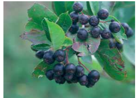
Abb. 1: Aroniabeeren

Wohl kaum jemandem ist wirklich bewusst, dass der Elefant, der zu den größten und stärksten Tieren der Erde zählt, seine Vitalkräfte ausschließlich aus pflanzlicher Nahrung (inkl. anhaftender und zugehöriger Mikroorganismen und Kleinstlebewesen) sowie aus der Ruhe bezieht. Dieses trifft ebenso auf